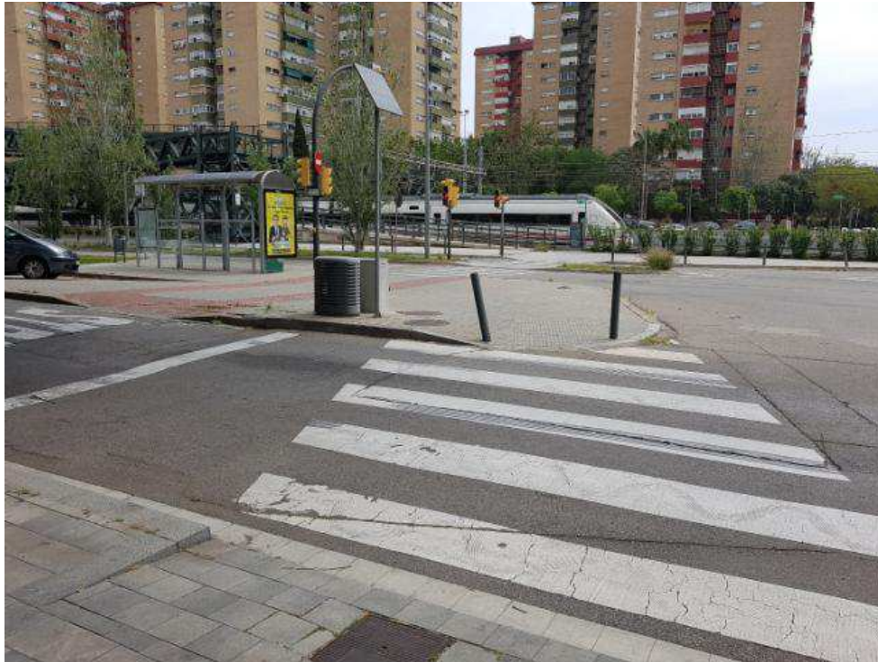
Il·lustració 2 Passos de vianants parcials, amb pivots que dificulten el pas. A la imatge, el pas de connexió amb la rampa que barreja vianants i ciclistes.