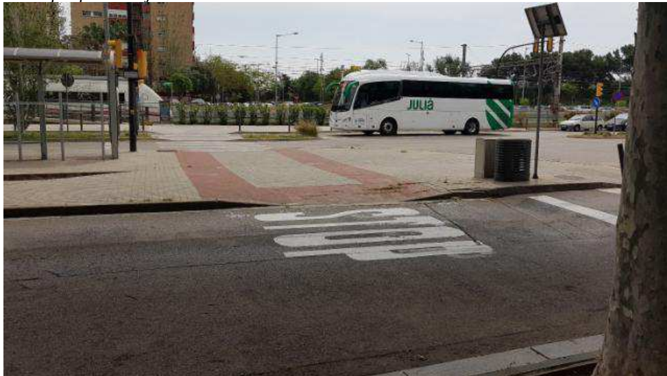
Il·lustració 3 La segregació de vianants i ciclistes amb l'ampliació del pas de vianants és fàcilment realitzable.