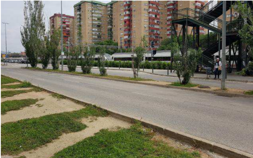
Il·lustració 4 Una veïna creuant per la zona natural de pas al sortir de les escales del pont nou. A la zona ajardinada es poden veure els camins naturals resultat del pas constant de veïns i veïnes.