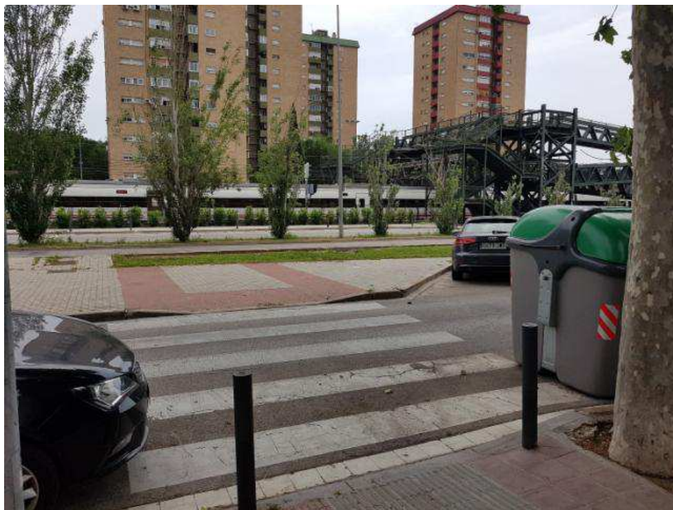
Il·lustració 6 Pas de vianants cap a una mitjana de caretera, sense continuïtat cap al pont. La mitgera no compleix cap requisit d'accessibilitat.