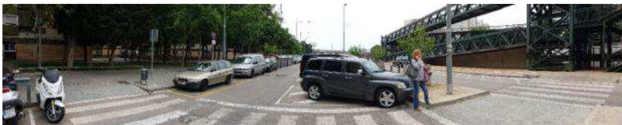
Il·lustració 7 Escassa visibilitat als passos de vianants de Gornal. La ciutadania ha d'avançar fins a la meitat de la calçada per veure si s'aproximen els cotxes.