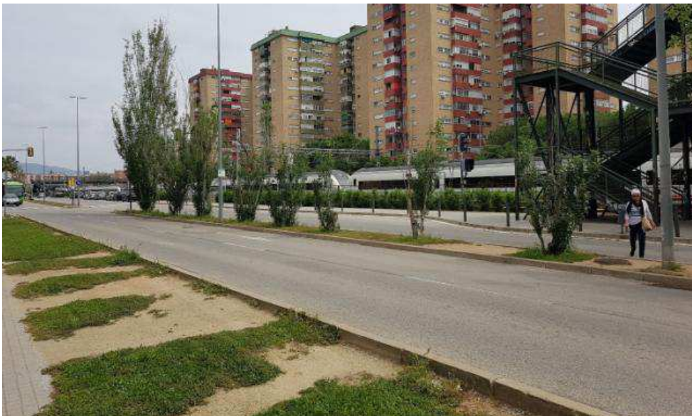
Il·lustració 5 Una veïna creuant per la zona natural de pas al sortir de les escales del pont nou. A la zona ajardinada es poden veure els camins naturals resultat del pas constant de veïns i veïnes.